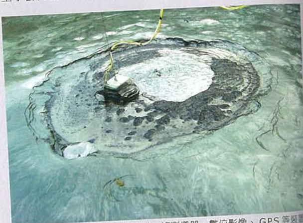
宋國城 燕巢泥火山 (影像局部) 偵測儀器、數位影像、GPS 等裝置 2005

本偵測站將於 2005 年實施三個實驗計畫。第一個實驗案「反演化偵測小組」藝術家張新丕將以「如影隨行」的方式，與動物保育專家裴家騏作密切合作，他們選擇了「迷彩」與「白化」的課題來研究動物不具功能性的行為，並以文件、物件與影像模擬生