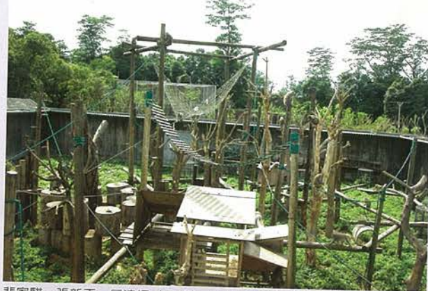
裴家騏、張新丕 反演繹 (局部) 文件、影像、物件裝置 2005

而這個展演更重要的是試圖轉化人文歷史發展中，人類自持的權力問題。包括「人類中心主義」(anthropocentrism)，到人類同理心延伸到其他高等動物的