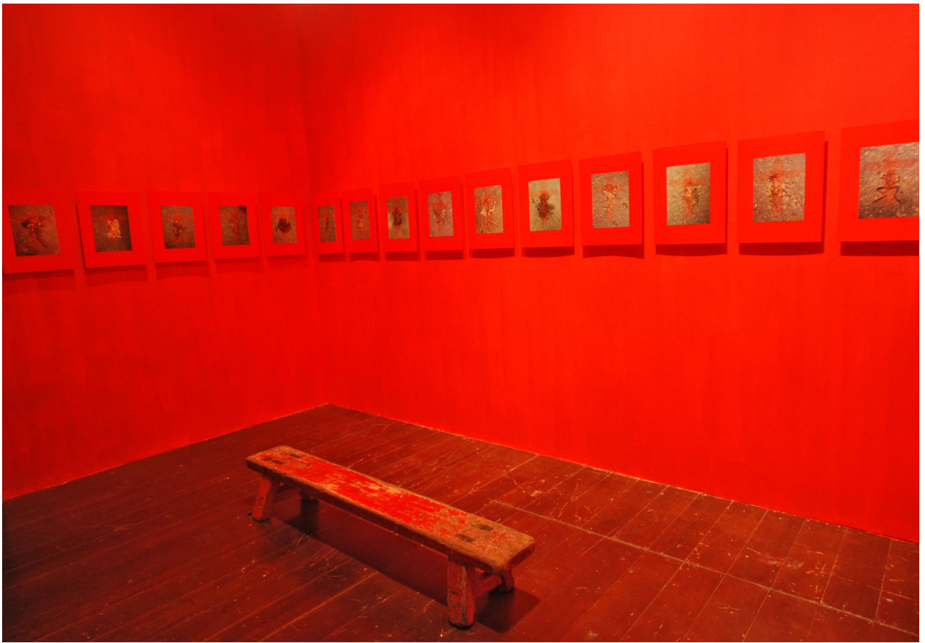
2006 年作品展出於「新濱碼頭」藝術空間現場紀錄。