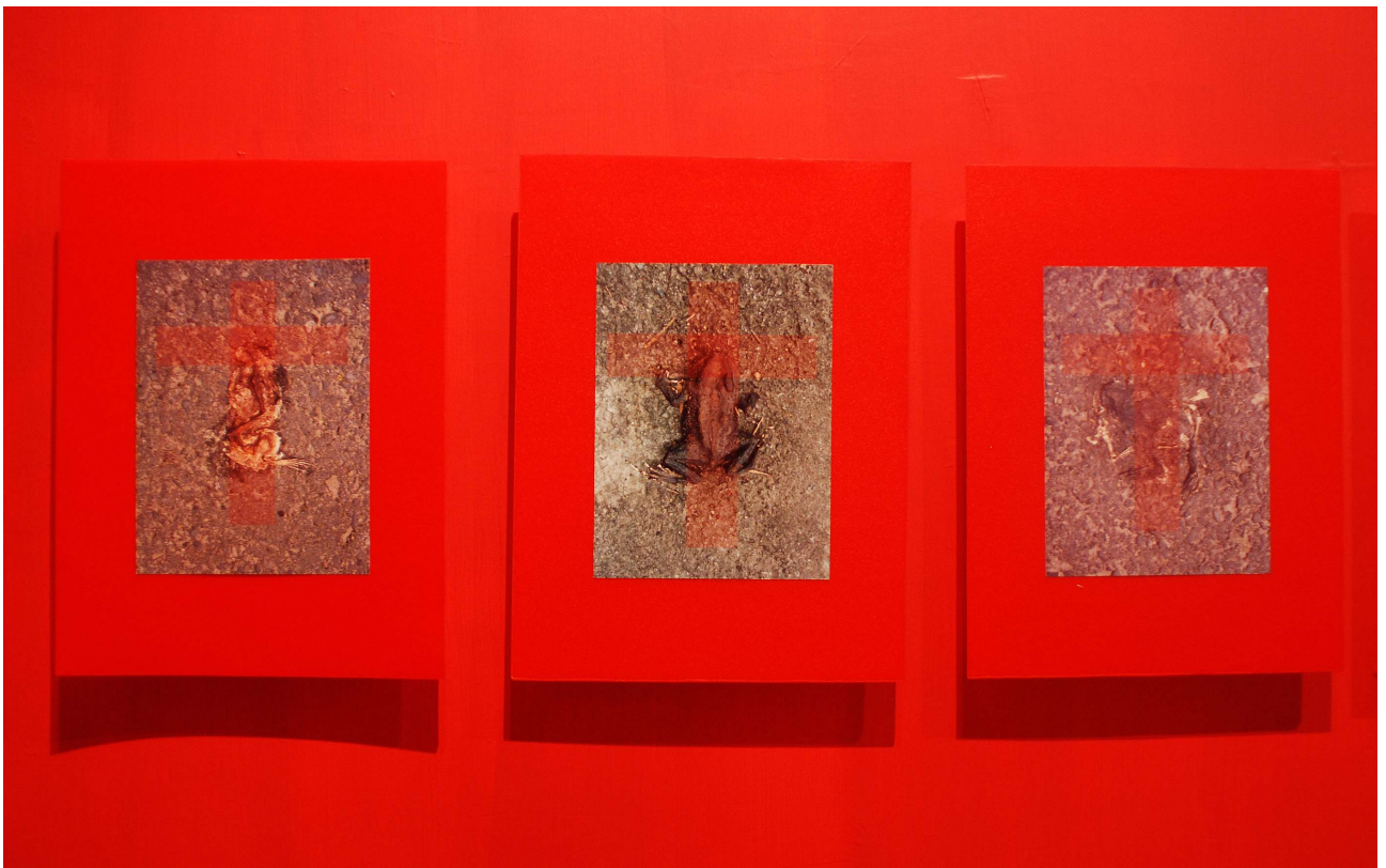
2006 年作品展出於「新濱碼頭」藝術空間現場紀錄。