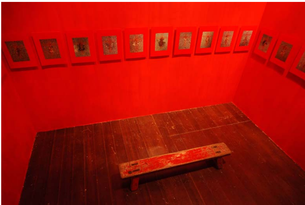
2006 年作品展出於「新濱碼頭」藝術空間現場紀錄。