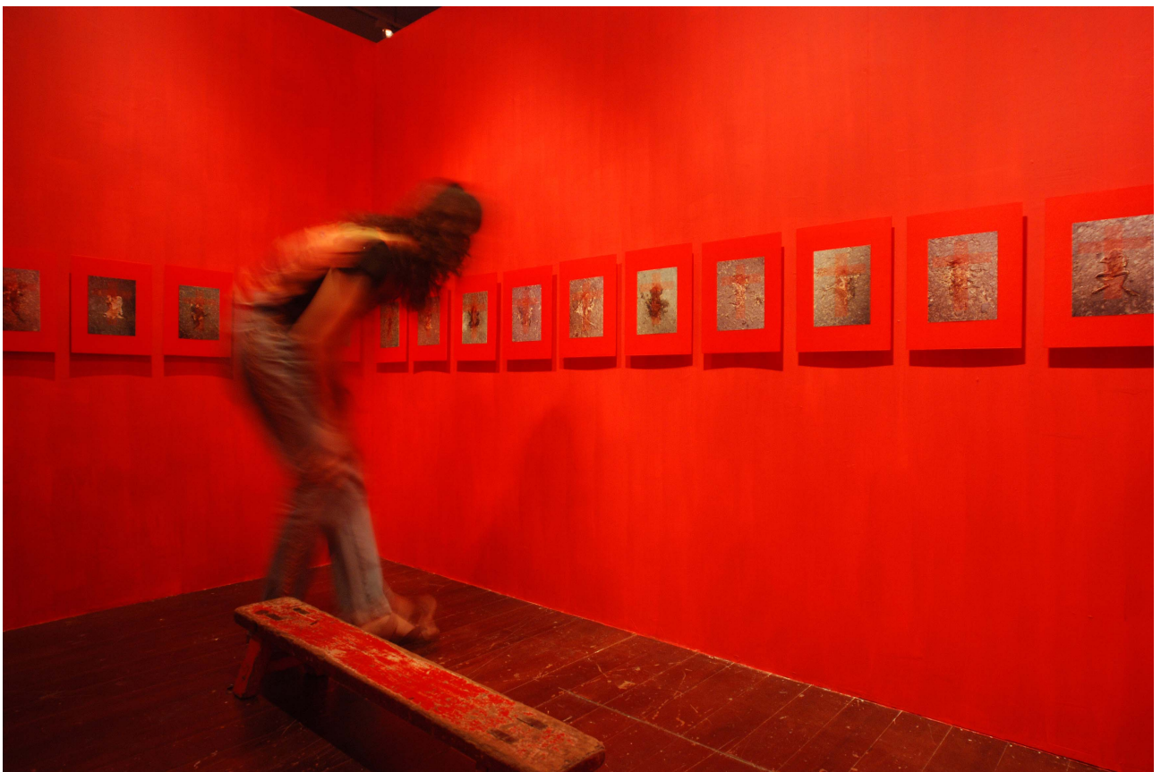
2006 年作品展出於「新濱碼頭」藝術空間現場紀錄。